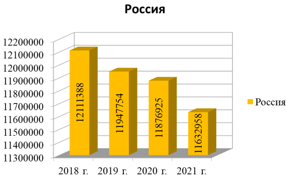
Рис. 2. Численность инвалидов (млн. чел.) в России с 2018 по 2021 год