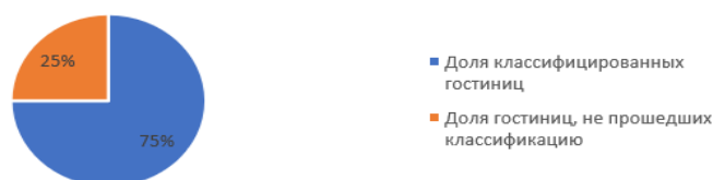
Рис. 1. Информация о гостиничных предприятиях по процедуре классификации (г. Липецк) на 01.04.2023 г.

Сравнивая данные полученные из Реестра [10] и с сайта Липецкстата [8], установлено, что в 2022 году в городе Липецке (по данным Липецкстата) работало 48 ед. коллективных средств размещения (1485 номеров с 2885 местами). В тоже время в Реестре [10] на 01.04.2023 г. находится 36 гостиничных предприятий (1326 номеров с 2328 местами) города Липецка. Таким образом, только 75 % всех гостиничных предприятий прошли процедуру классификации, имеют все основания для своей деятельности (см. рис. 1.).