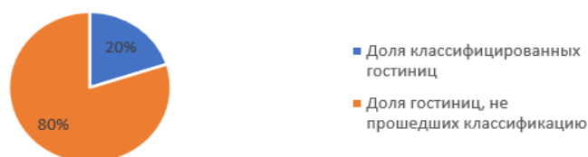
Рис. 2. Информация о гостиничных предприятиях по процедуре классификации (г. Елец) на 01.04.2023 г.

Качество предоставления гостиничных услуг зависит от категории гостиничного предприятия в разрезе характеристик номерного фонда. В результате проведенного исследования установлено, что 1241 номер (2078 мест) гостиничного фонда города Липецка