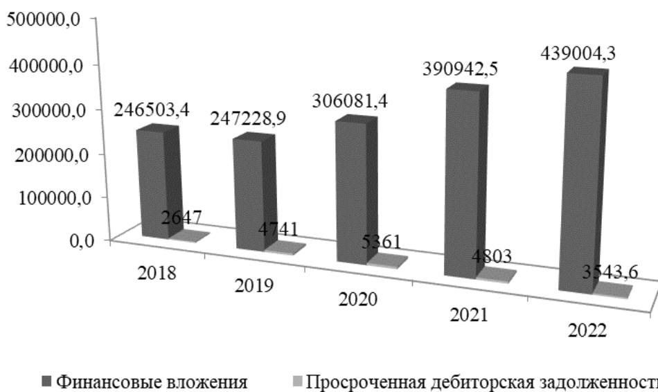
Рис. 2. Динамика объема финансовых вложений и просроченной дебиторской задолженности российских компаний, млрд. руб. [9,10]

организаций вследствие увеличения финансовых рисков и необходимости грамотного управления этими рисками.