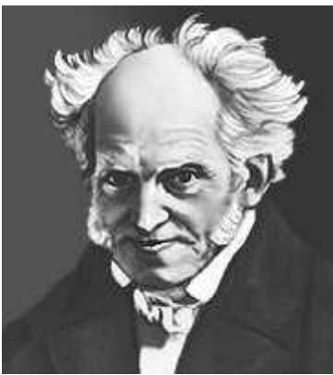
Артур Шопенгауэр 1788 - 1860

Много идей и открытий принес XIX век. В этом вряд ли кто-то усомнится. Их значение простирается далеко за рамки историко-философских исследований, и интересны они не только философам. Окидывая взором богатейший философский массив, невольно задумываешься о том, что младогегельянцы, марксисты, позитивисты, - все те, кто творил на заре неклассической эпохи, - пожалуй, поспешили с выводом о том, что философия закончила свое существование. Они утверждали, что больше нет оснований ждать от философии каких-то невероятных свершений в сфере духа, решений насущных вопросов, которые кажутся человечеству самыми главными. Гегель, по их мнению, завершил то движение, которое можно назвать философским прогрессом, написав кульминационную философскую систему Нового времени. После него шансы философии попасть в точное соответствие между бытием и сознанием практически оказались равными нулю.