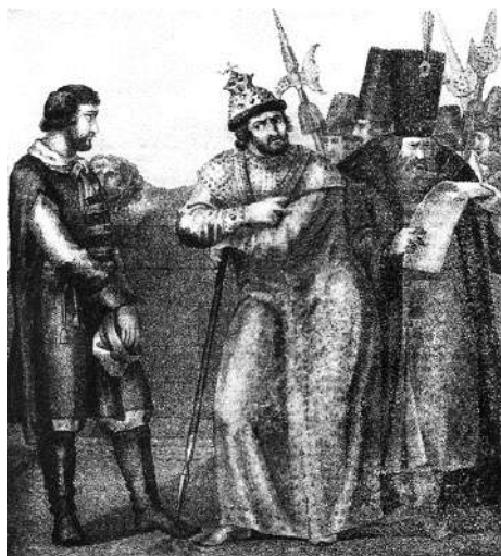
Чориков Б. Иван Грозный выслушивает письмо от Андрея Курбского

К 1560 г. царь начал тяготиться реформами, ведущими к ограничению его власти. Постепенно начинается отстранение реформаторов, закончившееся их полным уходом от власти. Иван IV начинает вести самостоятельную политику, которая особенно ярко проявилась в начавшейся в 1558 г. Ливонской войне, куда многие из реформаторов были назначены воеводами. Неудачи в войне вызвали у царя подозрения в причастности к этому отстраненных им бывших соратников. Начинаются казни и опалы. В апреле 1564 г. один из сторонников реформ, князь Андрей Михайлович Курбский, опасаясь ареста, бежал в Литву. Разногласия царя и А.М. Курбского стали основанием для появления оригинального памятника литературы - «Переписки Ивана Грозного с Андреем Курбским».