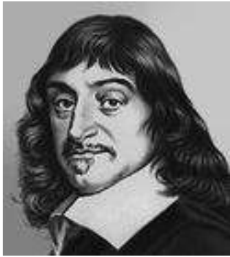
Рене Декарт 1596 - 1650

Философией Нового времени (или новоевропейской философией) называют западноевропейскую философию 17 – начала 19 веков. С социально-экономической точки зрения, это было время буржуазных революций и становления буржуазного общества. Но для развития философии, которая лишь очень опосредованными путями связана с экономическим базисом жизни общества, более