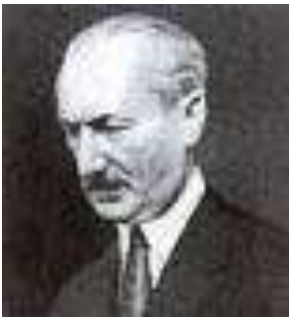
Мартин Хайдеггер 1889 - 1976

С какими чаяниями человек подходит к новому веку? Любые вехи ему свойственно воспринимать как некие пределы, за которыми открывается лучшая жизнь. Появляется больше оснований для упований и надежд. При всем пафосе любого серьезного рубежа, не совсем так было в эпоху вхождения в новый XX век. Такой совокупности проблем и нерешенных вопросов не было ни в одном вековом рубеже из тех, которые были осмыслены в культуре так же серьезно и основательно. Но к философии предъявлялись особые требования.