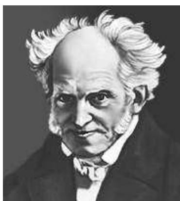
Артур Шопенгауэр 1788 - 1860

Много идей и открытий принес XIX век. В этом вряд ли кто-то усомнится. Их значение простирается далеко за рамки историко-философских исследований, и интересны они не только философам. Окидывая взором богатейший философский массив, невольно задумываешься о том, что младогегельянцы, марксисты, позитивисты, - все те, кто творил на заре неклассической эпохи, - пожалуй, поспешили с выводом о том, что философия закончила свое существование. Они утверждали, что больше нет оснований ждать от философии каких-то невероятных свершений в сфере духа, решений насущных вопросов, которые кажутся человечеству самыми главными. Гегель, по их мнению, завершил то движение, которое можно назвать философским прогрессом, написав кульминационную философскую систему Нового времени. После него шансы философии попасть в точное соответствие между бытием и сознанием практически оказались равными нулю.