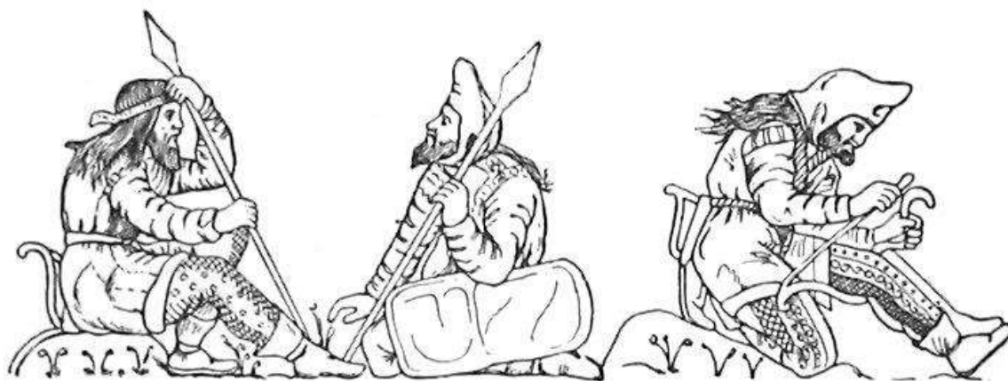
Скифы. Изображение на греческой вазе.