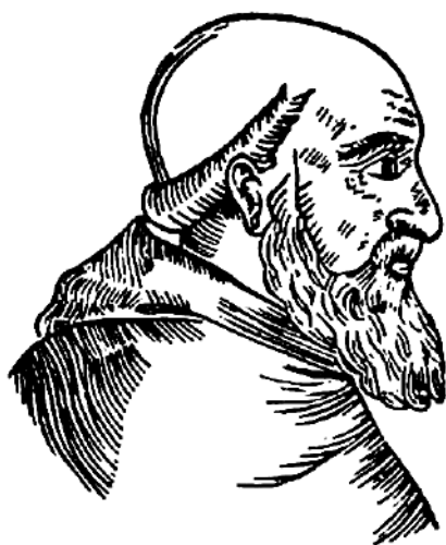
Джованни Плато Карпини

Дипломатическая миссия Рубруку не имела успеха, но описание путешествия в Монголию является ценнейшим свидетельством очевидца XIII в. Оно было впервые опубликовано в 1589 г.