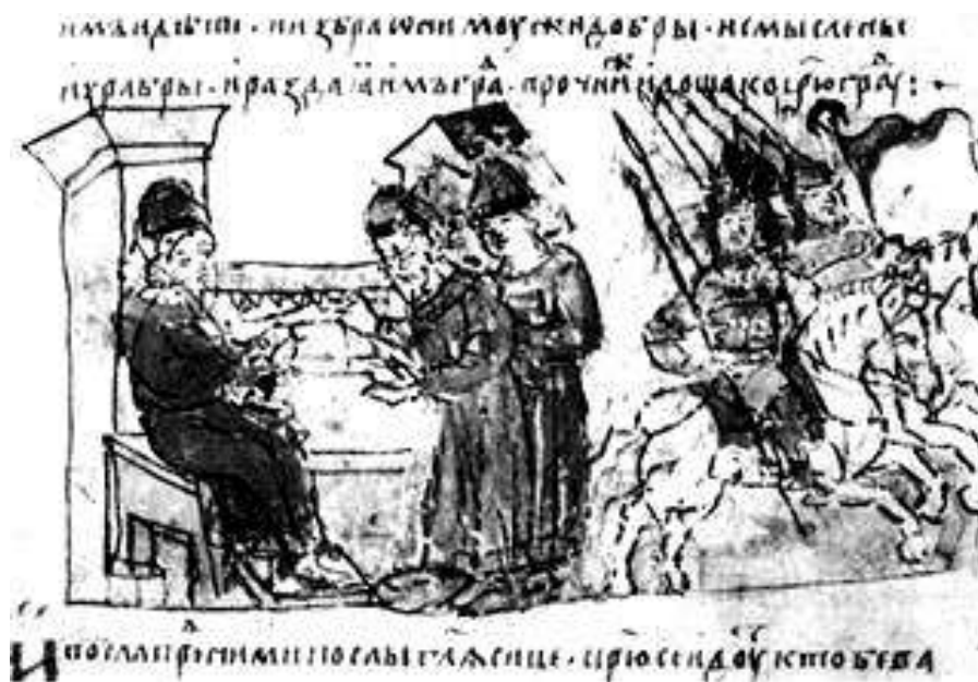
Призвание варягов. Летописная миниатюра.