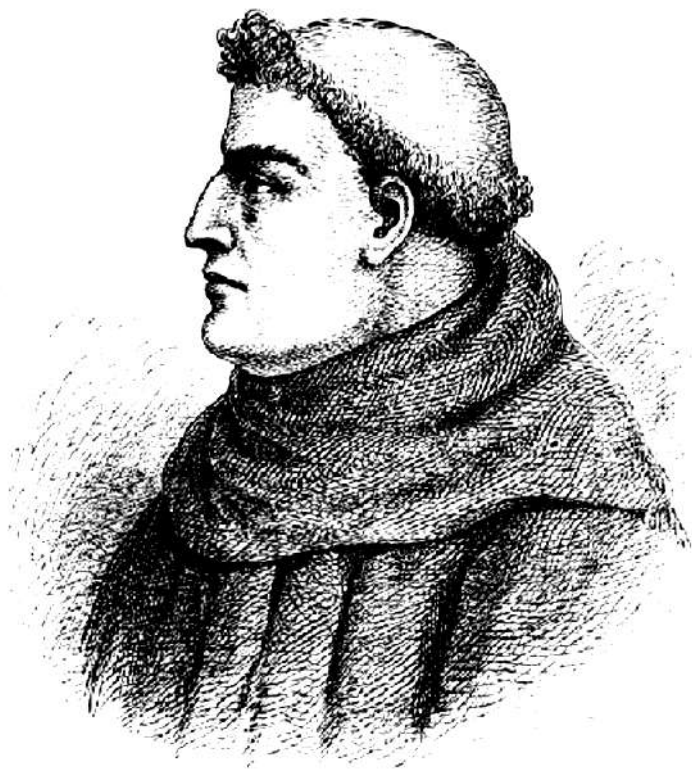
Гильом де Рубрук

Великая Монгольская империя оказывала решающее влияние на политику стран Европы и Азии в XIII в. Завоевательные походы монголо-татар, их быт, нравы и самобытная культура привлекли внимание правящей верхушки Европы. В Монголии было отправлено несколько посольств с целью установить дипломатические отношения, узнать культуру, религию и национальные особенности монголо-татарских племен. В результате появилось несколько описаний Монгольской империи, самые известные из них были составлены фламандским монахом Гильомом Рубруком и итальянским монахом Джовани Плано Карпини . Их работы являются наиболее полными и ценными описаниями Монгольской империи, частью которой в XIII в. стали и Русские земли.