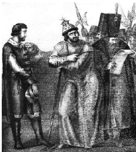
Чориков Б. Иван Грозный выслушивает письмо от Андрея Курбского

К 1560 г. царь начал тяготиться реформами, ведущими к ограничению его власти. Постепенно начинается отстранение реформаторов, закончившееся их полным уходом от власти. Иван IV начинает вести самостоятельную политику, которая особенно ярко проявилась в начавшейся в 1558 г. Ливонской войне, куда многие из реформаторов были назначены воеводами. Неудачи в войне вызвали у царя подозрения в причастности к этому отстраненных им бывших соратников. Начинаются казни и опалы. В апреле 1564 г. один из сторонников реформ, князь Андрей Михайлович Курбский, опасаясь ареста, бежал в Литву. Разногласия царя и А.М. Курбского стали основанием для появления оригинального памятника литературы - «Переписки Ивана Грозного с Андреем Курбским».