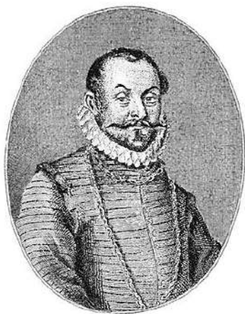
Барон Сигизмунд Герберштейн